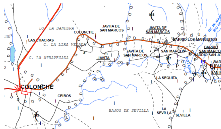
Figura 3. Mapa en formato pdf, utilizado para establecer la distancia entre poblados

Para poder encontrar el camino más corto se tienen que evaluar todas las rutas posibles para unir esos poblados, por lo cual además de identificar los poblados, se han identificado los cruces de caminos (identificados con las formas de pin) de tal forma que se puedan evaluar los caminos por tramos.